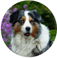
Alant von Kraut und Rüben

barer Nähe der Hochschulgebäude muss es mehr sichere und überdachte Fahrradstellplätze geben.